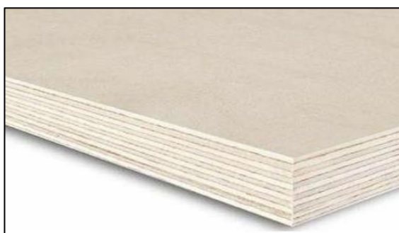
Figura 1. Pannello in compensato di tutto pioppo