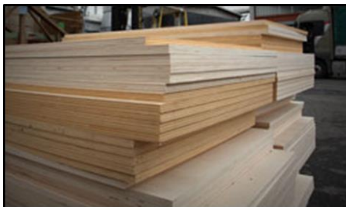
Figura 2. Pannelli in compensato di pioppo.

Il pannello in compensato di tutto pioppo (Figura 2) si realizza da sfogliati di pioppo (Figura 3), generalmente in numero dispari, incollati fra loro e con fibra incrociata simmetricamente. Le facce esterne possono avere la fibratura del legno disposta sia nella direzione longitudinale sia trasversale. Gli strati sono incollati secondo il senso delle venature in strati adiacenti solitamente posti ad angolo retto tra loro (BS EN 313-2, 2000).