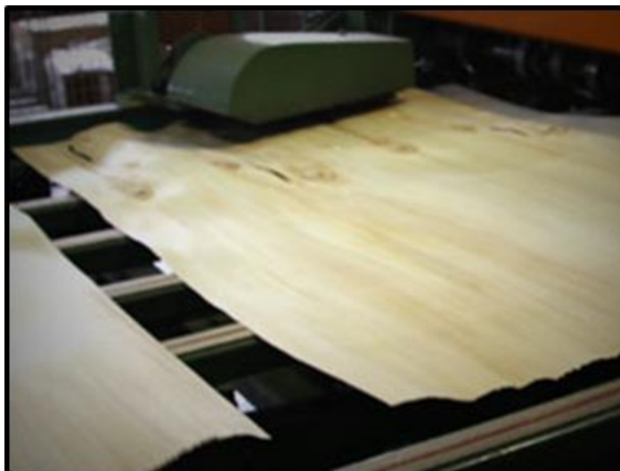
Figura 3. Fogli di pioppo.

Il processo produttivo del pannello in compensato di pioppo può essere suddiviso nelle seguenti fasi principali: